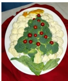
Premio del Presidente di Circostrizione