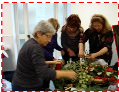
Le maestre preparano il materiale didattico