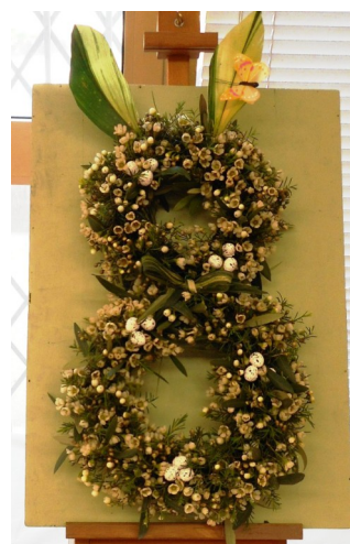
3° premio: Teresa Colla