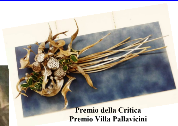
Premio della Critica Premio Villa Pallavicini

accompagnato nella Mostra Concorso di Decorazione Floreale "Seguendo la stella" .